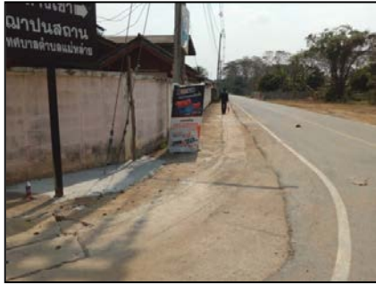
โครงการขยายเขตประปา บริเวณบ้านนางมาเรียน อุดธรรมชัย ถึงฉาปนสถาน หมู่ที่ ๕